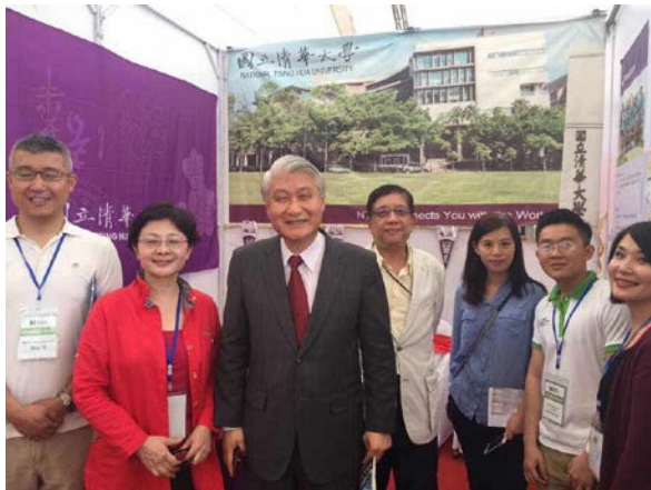
圖八：本校代表團與駐越代表處石大使合照