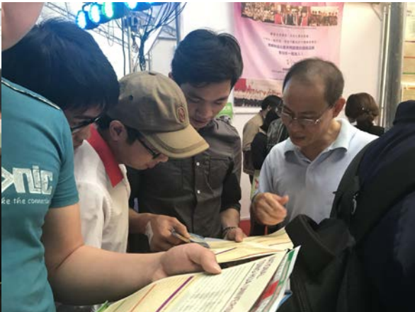
圖四：清大越南校友向學生分析科系資訊