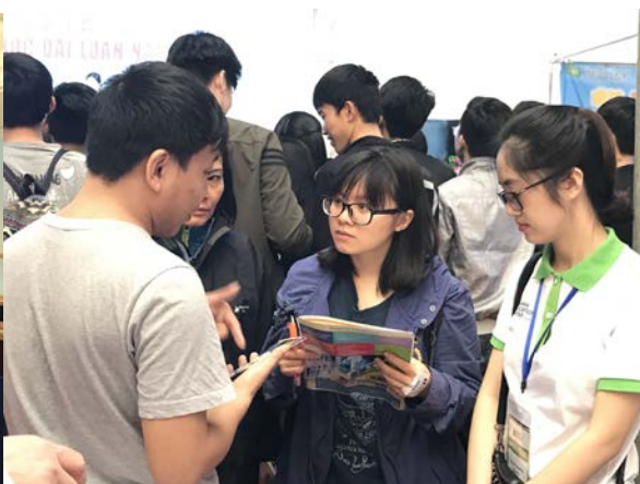
圖二：教育展攤位越南學生詢問入學資訊