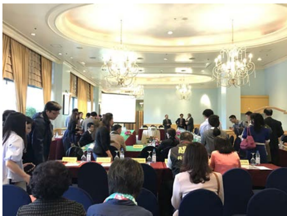
圖一：臺越學術交流座談會