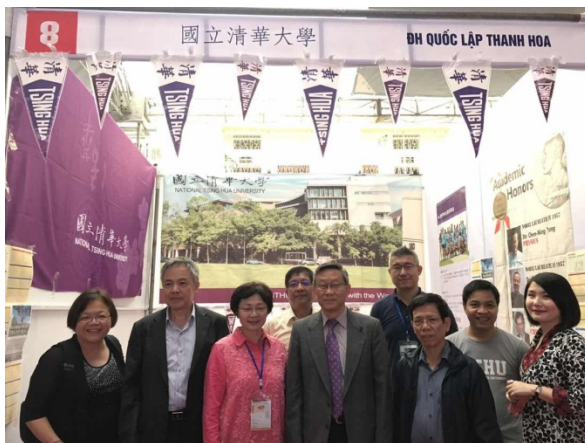
圖十：本校代表團與賀陳校長合照