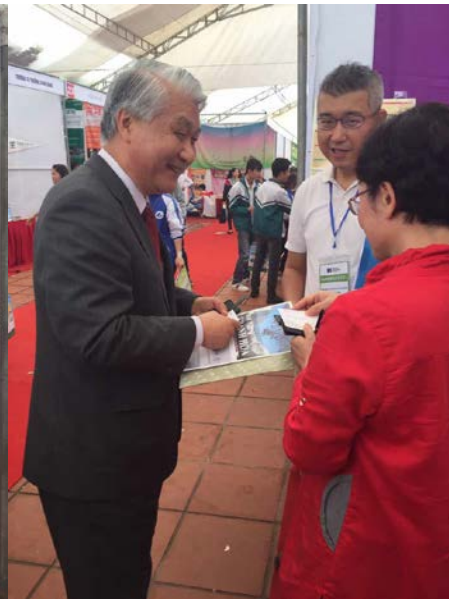
圖七：駐越南代表處石大使訪問本校攤位