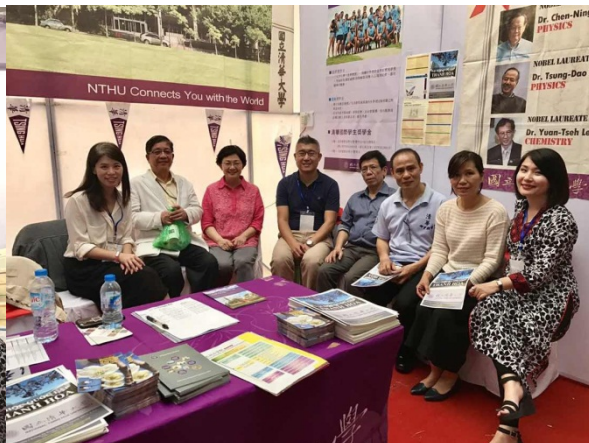
圖十一：本校代表團與河內傑出校友合照