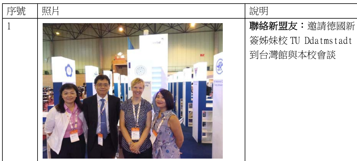
圖三：會場照片集錦