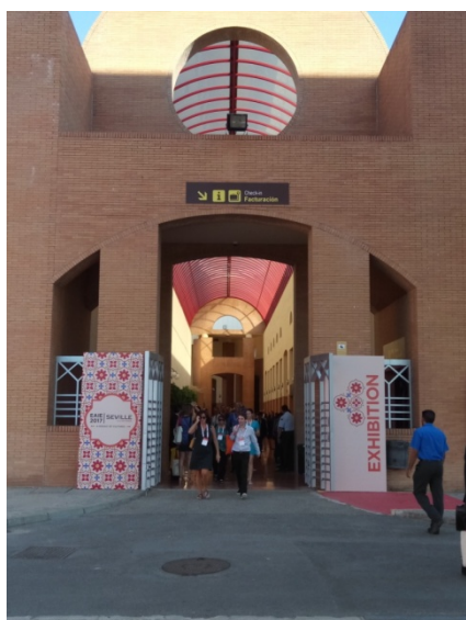
圖一：本次年會展入口