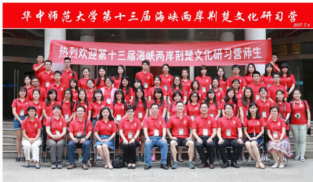
第十三届荆楚文化研习营大合影