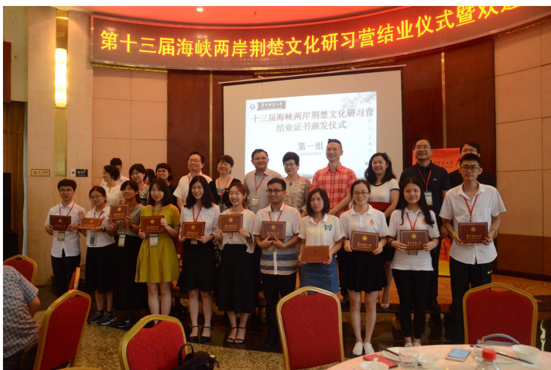
第十三届海峡两岸荆楚文化研习营结业仪式