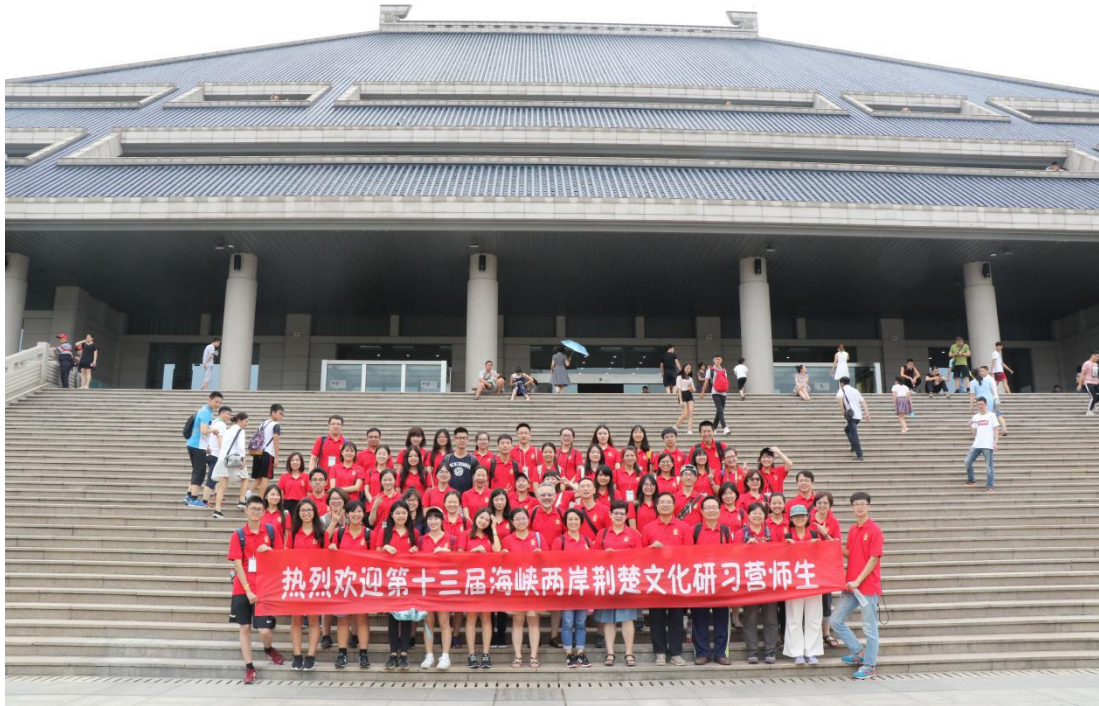
与湖北省博物馆的合影