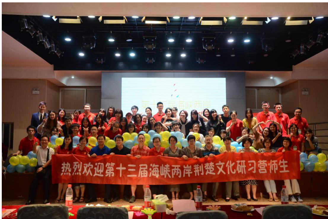
联谊晚会集体合影