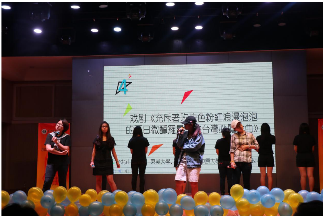
台湾小伙伴的话剧表演