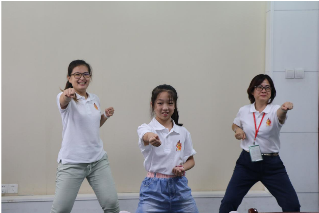
中华武术博大精深